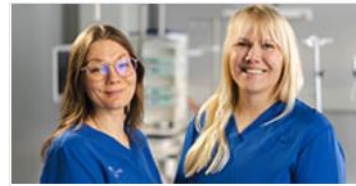
KYS erikoissairaanhoidon palvelut