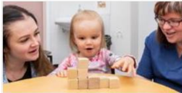
Lasten, nuorten ja perheiden palvelut