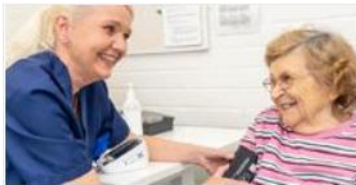
Terveys- ja sairaanhoitopalvelut