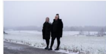
Mielenterveys- ja päihdepalvelut