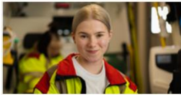
Kiireellinen hoito ja päivystys

Palvelut - Pohjois-Savon hyvinvointialue - Pohjois- Savo ( pshyvinvointialue.fi )